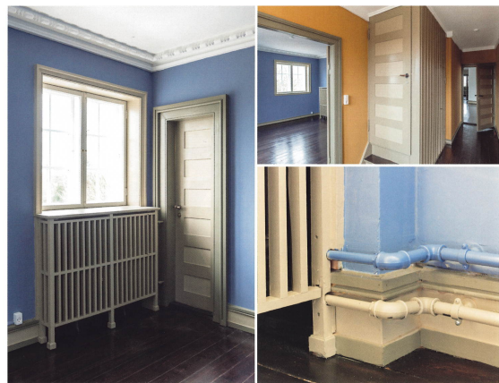
De fire værelser på førstsalen er malet i en ly, blå nuance meget tæt på den oprindelige. I et bjørne af kælderen står en kamin med 12 gumle støbjørnstøtterne. Kaminen er dog ikke tilladt i skorsten i dag.