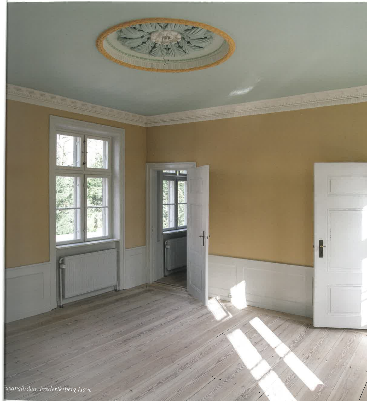
asangården, Frederiksberg Have