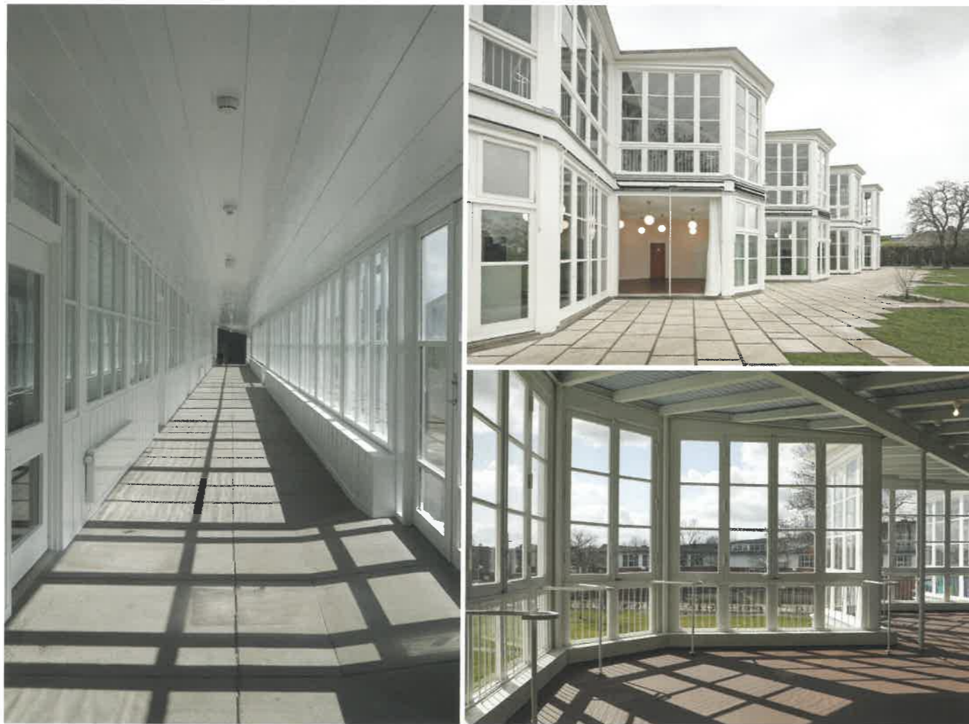
På Friluftsskolen var sundhed vigtig – lys, luft, håndbyggejne og god mad var vigtige ingredienser i hverdagen. Nordfløjen er under renoveringen genskabt med en glasvæg til gangen, hvor det udendørs trækkes ind. Tidligere var der bænke langs væggen.