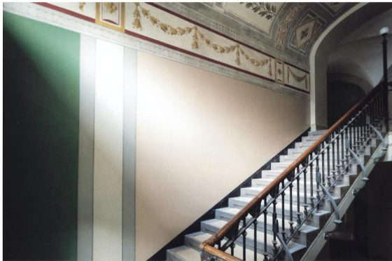
FOREGÅENDE SIDE SAMT HEROVER: Fløveren har grøne vægge, mens træpernerne har røde og grønne fliser, og tapeten på første sal har mørkeblå vægge. Høje træpernerum er rigt dekoreret på vægge og loftet med blomsterranker, mønstre og symboler i skovrøststil.