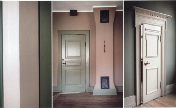
HEROVER: I træpernergangen er der malet med limfarve, som kan tage op til to år at tørre helt op. Efterskibet bliver overfladen derfor mere mat. Løse farvesejlerne er malet en tynd grå staffering.

Bygningen ligger næsten gemt væk fra gaden, som om man ikke skal komme for tæt på, medmindre man har et ærinde derinde. Men når man først er gået gennem porten på hjørnet af Stormgade og Vester Voldgade i det indre København, har passeret den lille brostensbelagte gård, og er kommet ind gennem den høje indgangsdør af tungt træ, åbner der sig et smukt og dekorativt indre i sprudlende farver og smukke mønstre. Oprindeligt var bygningen på hjørnet bestemt ikke bygget for alle. Den blev opført i 1893-1894 for Overformynderiet, der tog sig af umyndiges og bortblevne persons for- muur. Mange millioner kroner blev opbevaret af den landsdækkende institution, som allerede voksede ud af lokalerne i 1937 og flyttede videre til Holmens Kanal. Men nu kan alle interesserede komme ind, når ejendommen for alvor åbner sig for omverdenen i foråret 2019, hvor Københavns Museum åbner efter en flytning af selve museet fra Vesterbrogade og en markant istandsættelse af huset i Stormgade 18.